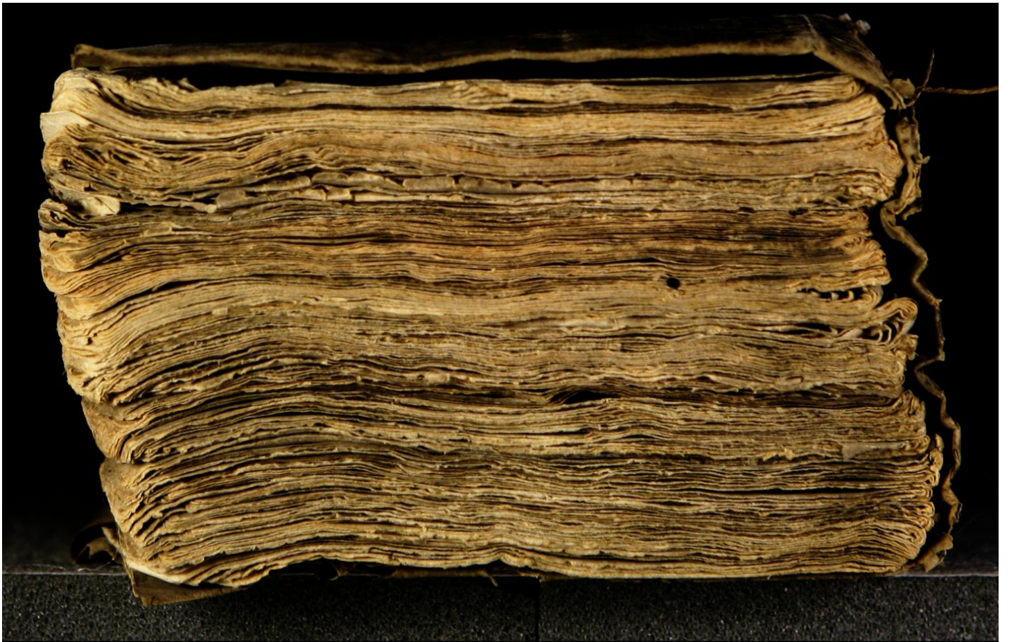
Early European Books, Copyright © 2009 ProQuest LLC. Images reproduced by courtesy of the Royal Library, Copenhagen. LN 588 8°